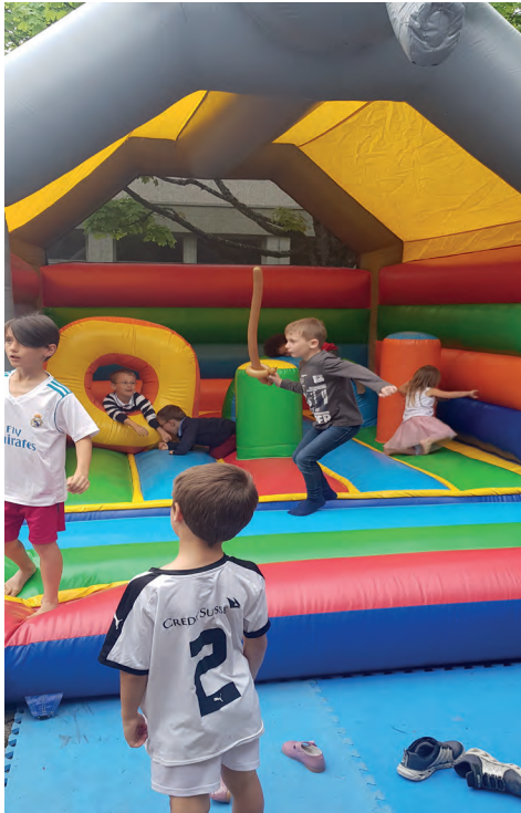
Bei den Kindern beliebt: Hüpfen in verschiedenen Varianten...