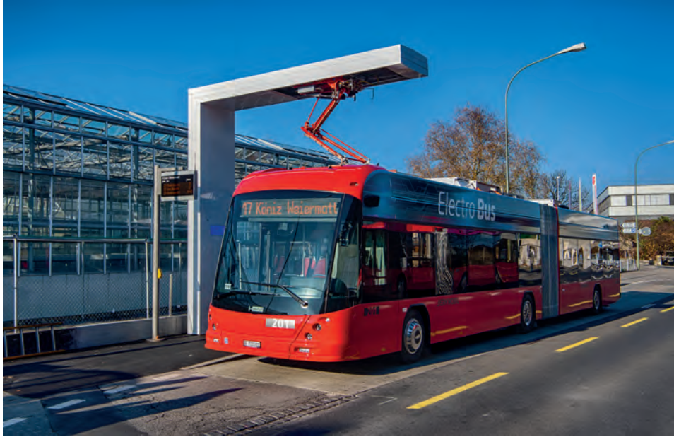
Elektrobuss der Linie 17 beim Aufladen.