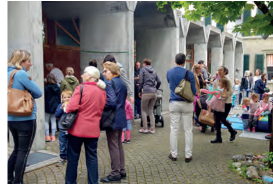
...während die Erwachsenen sich unterhalten.