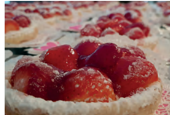
Bei allen beliebt: Erdbeertörtli