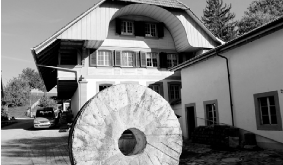
Der alte Mühlstein vor der über 500-jährigen Mühle

In der idyllisch gelegenen Mühle in Kriechenwil b. Laupen am Grenzbach «Bibere» zum Kanton Freiburg werden soziale Arbeit und die Produktion hochwertigen Bio-Mehls verknüpft. Die SAT-Mühle ist Teil des SAT-Projekts, welches wiederum dem Bürgerlichen Jugendwohn-