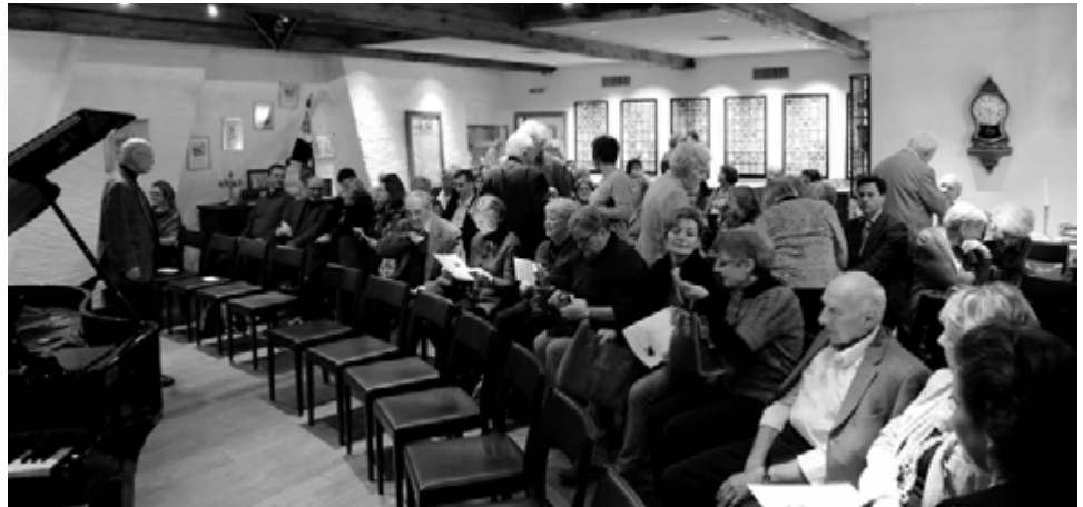
Angeregte Gespräche zwischen den zahlreichen Besuchern vor dem Konzert.

Je nach dem spielen wir in der Band dann