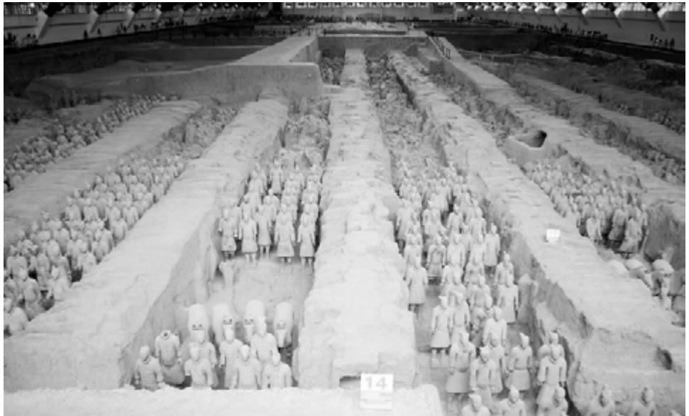
Blick in das grösste Pit auf dem Ausgrabungsgelände

Bis heute sind über 8'000 Figuren freigelegt. Jede dieser Figuren ist individuell gestaltet. Über 700'000 Arbeiter sollen 38 Jahre lang