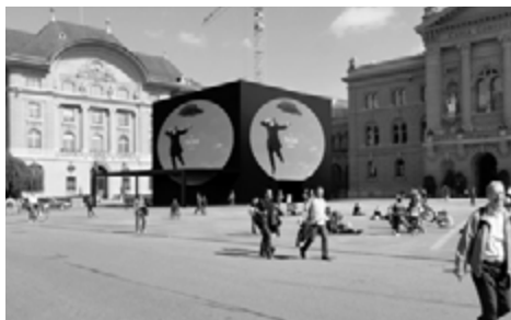
Der Panorama-Kubus auf dem Bundesplatz

Am 22. August 2014 steigt das grosse Eröffnungsfest auf dem Bundesplatz. Das Programm bietet unvergessliche Momente für Jung bis Alt: Barry-Show, Elefant bemalen, Medaillen prägen, ein Markt sowie viele Köstlichkeiten,