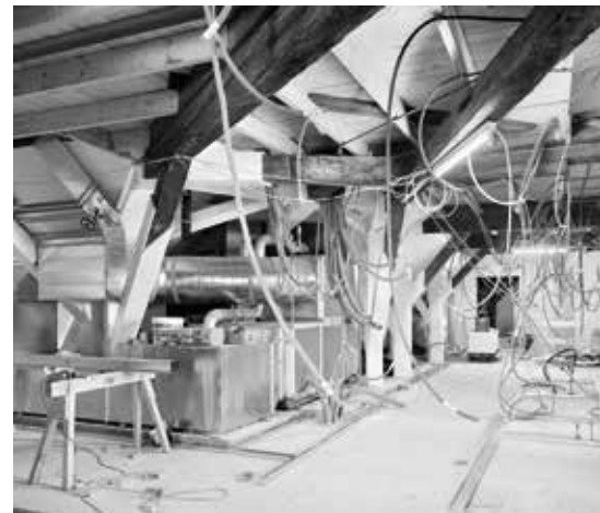
Blick in eine der drei Lüftungszentralen im Dachgeschoss. Die Zentrale wird im Bereich der weissen Verkleidungen hinter Gipswänden verschwinden. Das alte Gebälk wird weiterhin sichtbar sein.

Berner Generationenhaus im Web: www.begh.ch