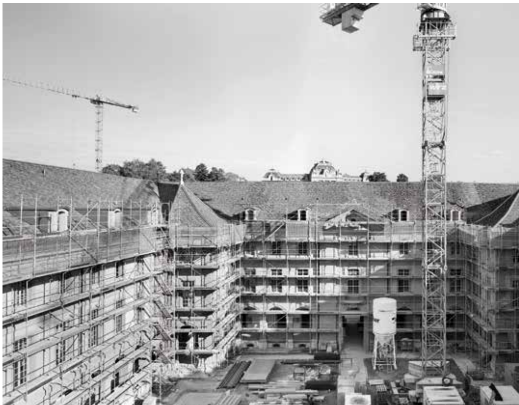
Das Dach des Burgerspitals ist fertiggestellt und die neuen Fenster zum Innenhof sind eingesetzt.

Text: Stefanie Gerber, Bilder: Thomas Telley