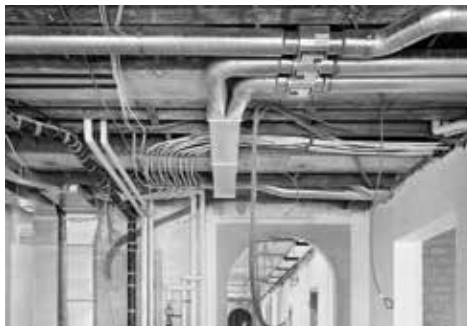
Der Einbau der Lüftung im gesamten Gebäude und der Haustechnik ist im vollen Gange.