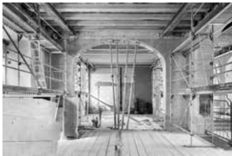
Blick in die neue Empfangshalle. Das Haupttor zum Bubenbergplatz auf der linken Bildseite. Auf der rechten Bildseite der Durchgang in den grossen Innenhof des Burgerspitals.