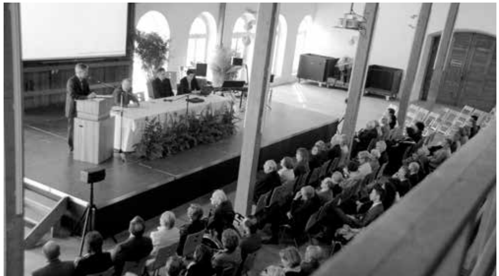
Hauptversammlung vom Mai 2013 in der Grossen Orangerie (Elfenau)

Eigentlich ist er noch jung, der Bürgerverband, obwohl er 1913 gegründet worden ist und heuer sein 100jähriges Bestehen feiert. Denn zu