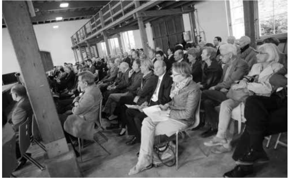
Nach dem geschäftlichen Teil geniessen die Mitglieder die kulturellen Darbietungen.

Heute nimmt der Burgerverband zwei ganz zentrale Funktionen wahr. Er informiert zum einen seine Mitglieder über das Geschehen in der Bürgergemeinde. Denn wie Mark Twain einmal spöttisch gesagt hat: Tatsachen muss man kennen, bevor man sie verdrehen kann. An jährlich zwei Hauptversammlungen erklärt der Verband daher aus erster Hand die Abstimmungsvorlagen und präsentiert vor Wahlen die Kandidaten und Kandidatinnen für die bürgerlichen Ämter. Er bietet so den Rahmen für den direkten Kontakt zwischen der Burgerschaft