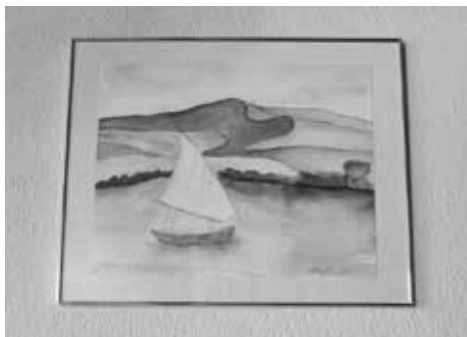
Aquarell von Marlène Geiser

Weiter liebe ich die Gartenarbeit, insbesondere die Pflege von Rosen und Orchideen. Ein weiteres Hobby von mir ist die Aquarellmalerei. Zudem reise ich gerne, vor allem in südliche Länder, und lese Krimis, Biografien und Australienromane mit Pionierhintergrund.