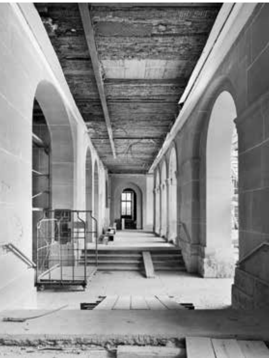
Quer zur Bildrichtung der Durchgang vom Bubenbergplatz zum grossen Innenhof. In Blickrichtung der Korridor Südwest. Am Ende des Korridors der Eingang zum Checkpoint / Kulturkaffee der Kinder- und Jugendförderung.