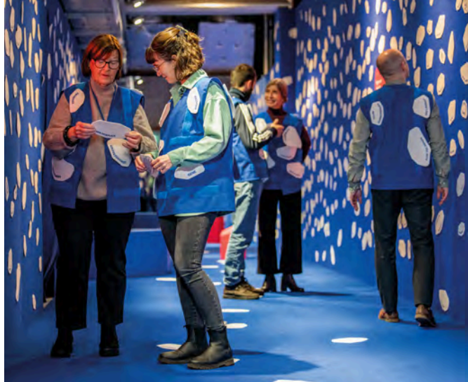
Ausstellung HILFE, ICH ERBE!

Sie bieten Menschen aller Generationen Beratung, Information und Lebenshilfe. Auch die Mieträume – ob unter den historischen Dachbalken oder im lebhaften Erdgeschoss – werden vielfältig genutzt. Das Berner Generationenhaus hat sich in den vergangenen Jahren kontinuierlich weiterentwickelt und ein immer grösseres Publikum erreicht. Heute ist es ein einzigartiger Ort der Begegnung und des Dialogs – und führt zugleich eine fast 300-jährige Tradition des sozialen Engagements im Haus fort.