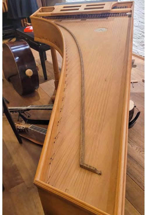
Wunderbare Musik, gespielt mit Instrumenten, die einigen im musikinteressierten Publikum unbekannt waren.