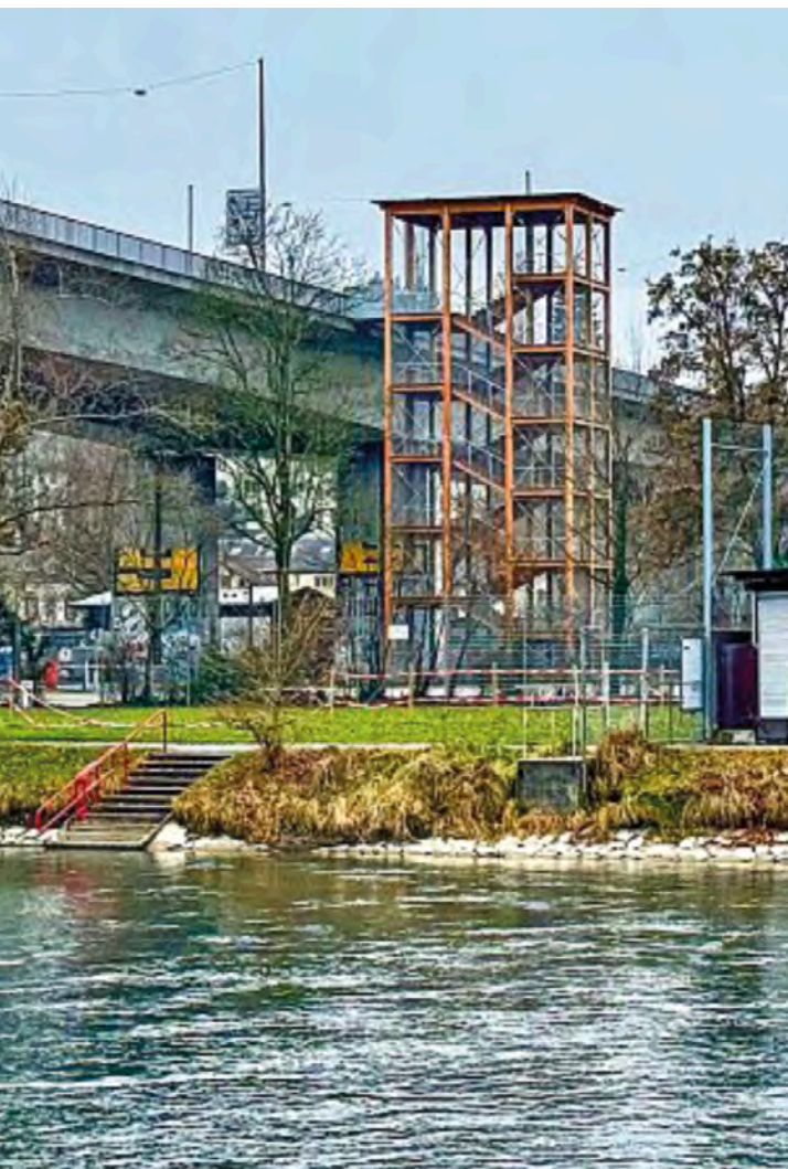
Neuer Akteur: Der Treppenturm in Holz an der Monbijoubücke.