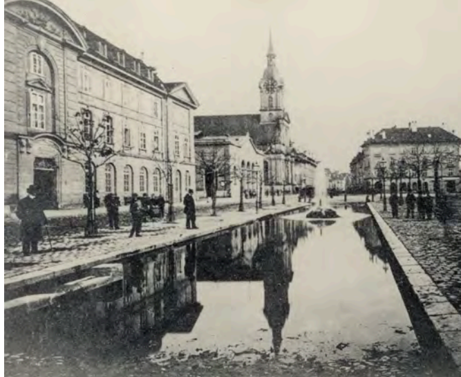
Die Rossschwemme, hier bereits mit dem Springbrunnen.

zu sehen. Dabei handelt es sich um die sogenannte «Rossschwemme». Hier mussten Kutschen und Pferde gereinigt werden, bevor sie in die Stadt einfahren durften.