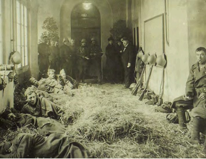
Im Korridor vor der heutigen Cafébar waren Soldaten untergebracht.

wirkte damals zeitweise romantisch überwachsen.