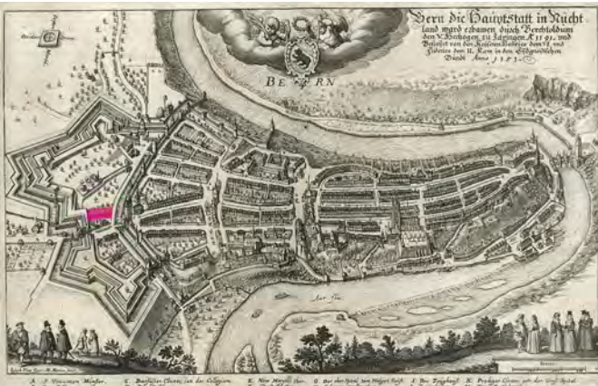
Hier entstand 1741 das Burgerspital.

Weibervolk», «arbeits scheue Männer» und «widerspenstige Jugendliche» einquartiert wurden – ein Begegnungsort der Generationen, wenn auch in einem ganz anderen Sinn als heute.