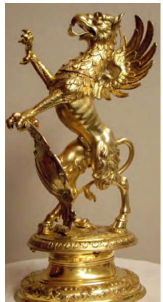
Trinkgefäss in Form des Vogel Gryf.

Spital des damaligen Berns erwarben. Mit diesem Kauf waren bereits die ersten Ansätze von Hilfeleistungen an notleidende Stubengenossen zu erkennen. Im Jahr 1485 erwarben die Weber ein eigenes Pfrundhaus (heutiges Pflege- und Altersheim), in dem bedürftige Zunftangehörige Unterstützung fanden. Die Zunft regelte zudem ihr praktisches Handwerk. So wurde z. B. verbindlich festgelegt, wie lange ein Tuch sein durfte oder wie viele Webstüh-