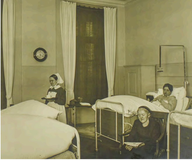
Blick in ein Krankenzimmer im Burgerspital.