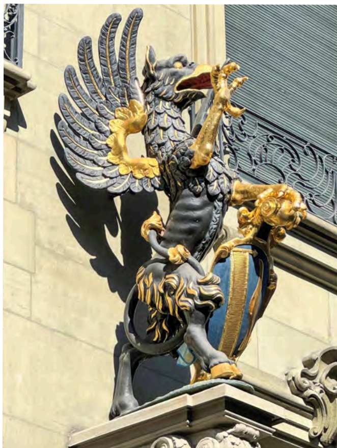
Der Vogel Gryf, das mythologische Fabeltier, hält das Zunftwappen an der Fassade des Zunfthauses der Webern an der Kramgasse 68.

Im Zunfthaus finden neben geschäftlichen auch gesellschaftliche Anlässen statt, die von den Zunftangehörigen geschätzt werden. So finden im historischen Zunftsaal unter anderem die Grossen Bött, festliche Zunftessen sowie Bescherung der Kinder am Kinderfest statt.