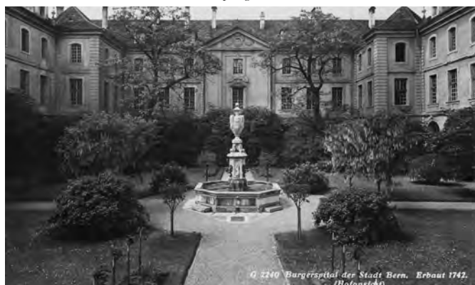
Der Innenhof: Die Aufnahme entstand zwischen 1905 und 1941.

Das Burgerspital wurde immer mehr zu einem Alters- und Pflegeheim. Anfang des 20. Jahrhunderts waren im zweiten Stock die zahlenden, bessergestellten Bürgerfamilien untergebracht, während im ersten Stock ärmere Bürgerinnen und Bürger – sogenannte Pfründner – lebten, die im Haushalt mit-helfen mussten. Der Innenhof