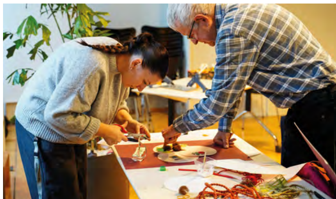
Workshop im Berner Generationenhaus

Einmal pro Monat versichert das Berner Generationenhaus einen Newsletter. Wer mehr wissen möchte über seine Angebote und sein Programm, kann sich hier anmelden: www.begh.ch/newsletter .