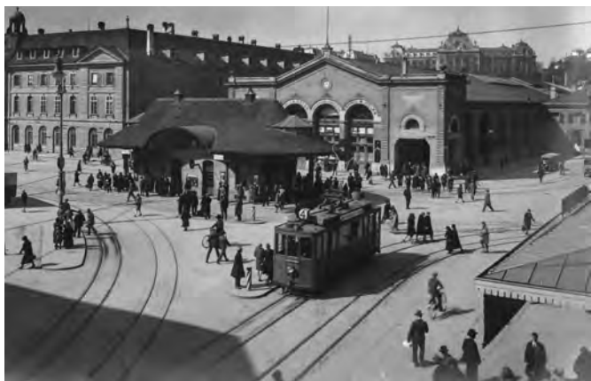
Für den Bau des neuen Bahnhofs musste der Christoffelturm weichen.