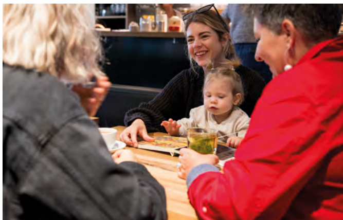
In die Cafébar dürfen auch eigene Getränke mitgebracht werden.